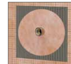
Schlüter®-KERDI-KM Manguitos para tuberías

para lograr una conexión segura de los pasos de tuberías con tuberías de 25 mm Ø