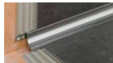
Schlüter®-DILEX Sistema de perfiles para juntas de movimiento sin mantenimiento

¿Desea saber más cosas sobre otros productos y soluciones de sistema Schlüter para la colocación de baldosas? Nuestros distribuidores disponen de los siguientes folletos explicativos. Asimismo encontrará más información en nuestra página en Internet www.schluter.es .