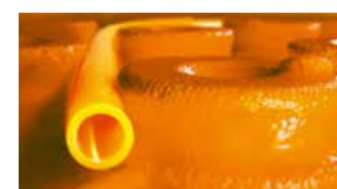
Schlüter®-BEKOTEC-THERM El pavimento de cerámica climatizado