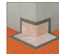
Schlüter®-KERDI-KERECK/FA esquina exterior

piezas soldadas preparadas para la fácil impermeabilización de rincones interiores