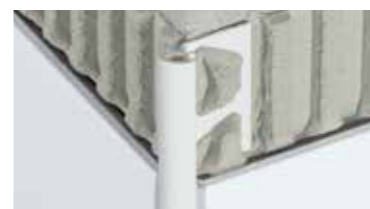
Schlüter®-RONDEC, -QUADEC, -JOLLY Sistemas de perfiles para el embellecimiento y protección de esquinas en paredes