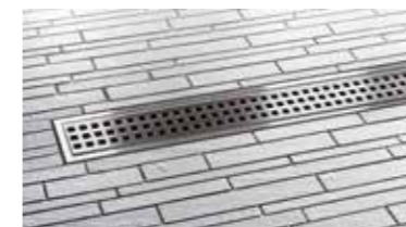
Schlüter®-KERDI-LINE Sistema de desagüe