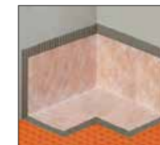
Schlüter®-KERDI-KERECK/FI esquina interior

para lograr una conexión segura de los pasos de tuberías con tuberías de 25 mm Ø