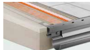
Schlüter®-Sistemas para balcones solución completa para la construcción y el saneamiento de balcones y terrazas